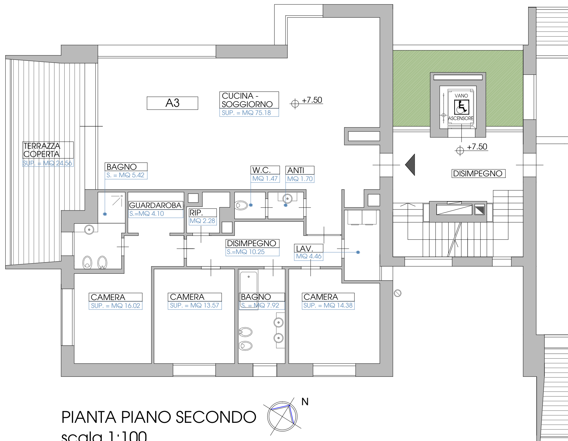
PIANTA PIANO SECONDO scala 1:100